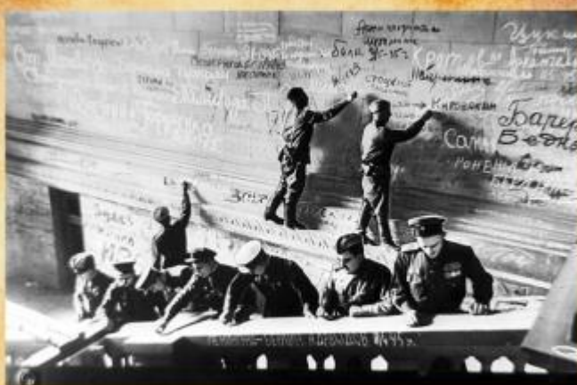
В Берлине расписался на стене Рейхстага