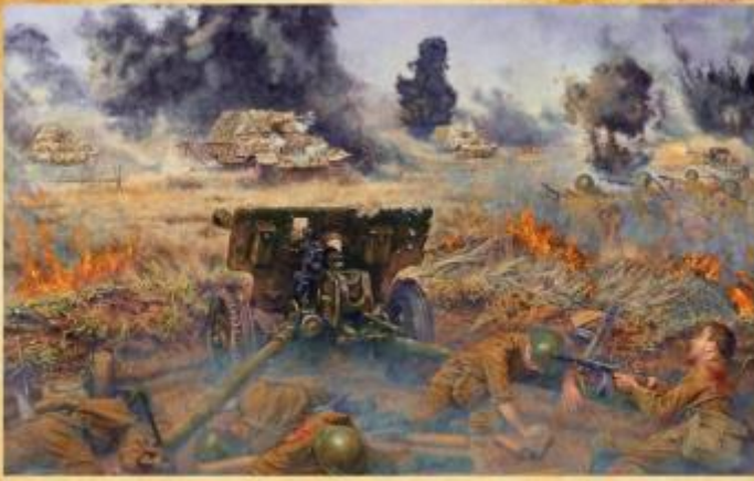
Был участником битвы на Курской дуге