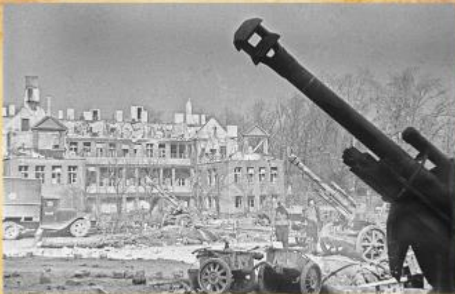
Участвовал в штурме города Кенигсберг